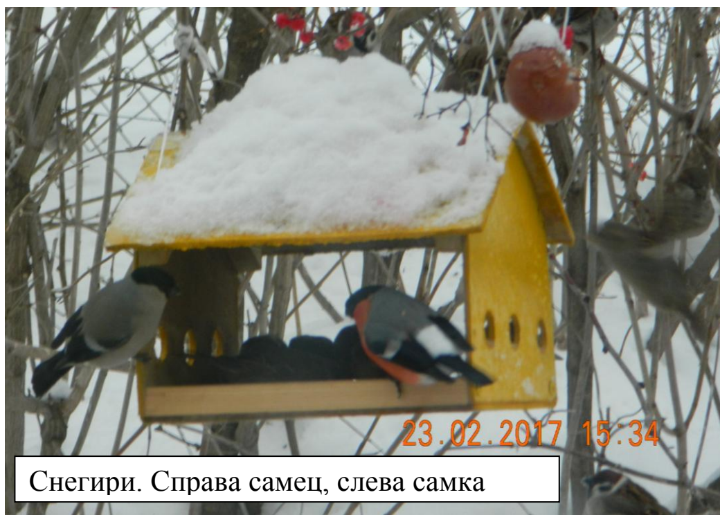
Снегири. Справа самец, слева самка