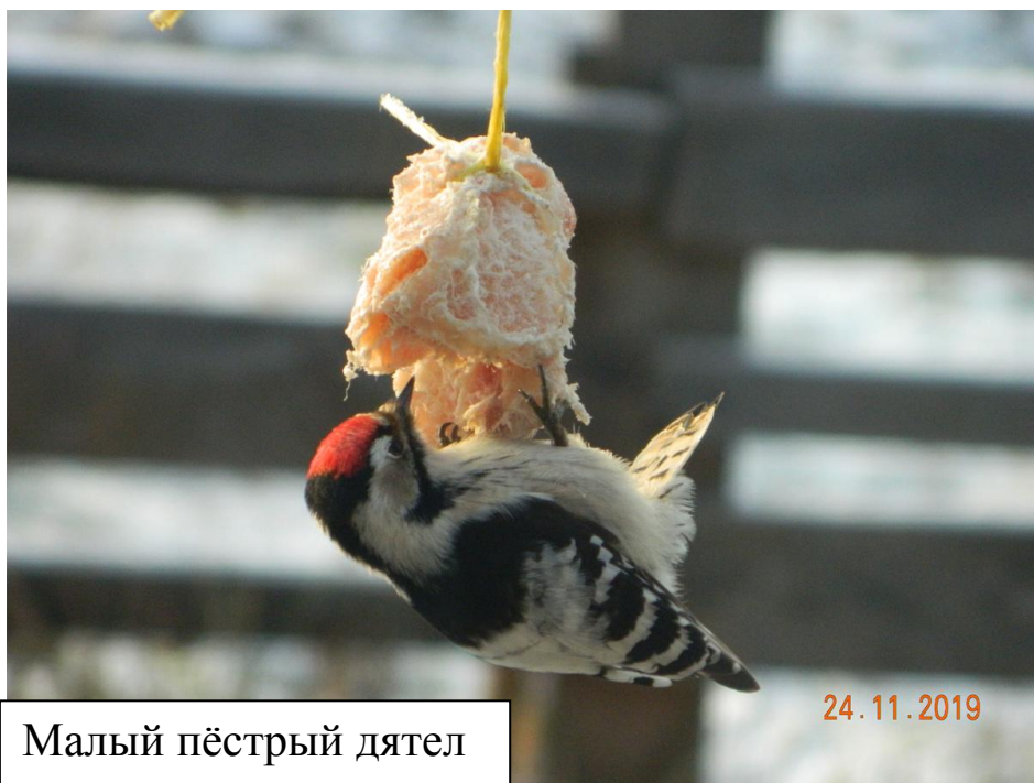
Малый пёстрый дятел